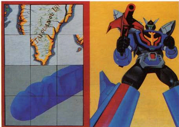
上 ●無敵鐵金剛的×× ／1996 下 ●大員紀事·鳳／1995