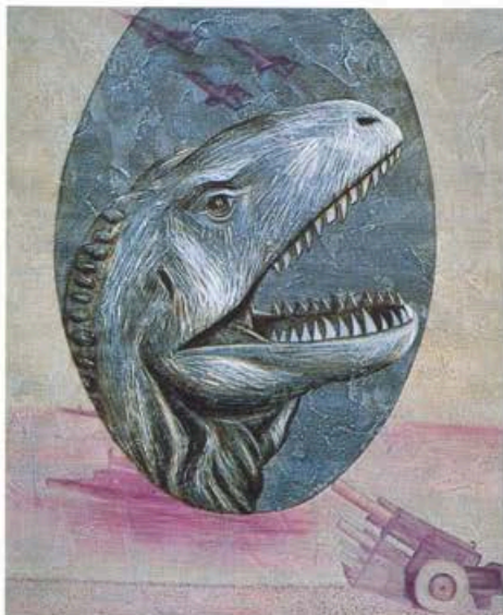
楊茂林 大員紀事·龍 1995 72×61公分 油彩·壓克力

除了「大員紀事」系列，楊茂林在此展中果然也提示了創作的內容進度。九六年作品「超人與孫悟空」及「無敵鐵金鋼的xx」顯示，台灣新新世代的英雄想像，已毫無痛苦地擺脫了母體文化與歷史情結的糾纏。在日美次文化圖騰的侵入流行和新世代的盡情消費下，不論中國情或台灣調的文化想像符號，到頭來都可能在我們的「本土」中快找不到它們的位置。曾經以刻畫中國歷史神話英雄起家，接著以建構台灣文化正宗圖騰為本務的楊茂林，在展開當代文化章節的刻畫時，似乎也只能以一種熱情擁抱的方式來接納這類異己而強悍的次文化圖騰，這當然是一種諷刺。因為在「Made in Taiwan」的標籤下，「Nothing made in Taiwan」似乎更是實情了！