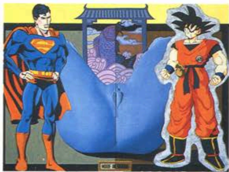
楊茂林 超人與悟空 1996 194×260公分 油彩·壓克力