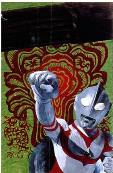
「鹹蛋超人與按摩棒」 1997 油彩·壓克力 194X260cm