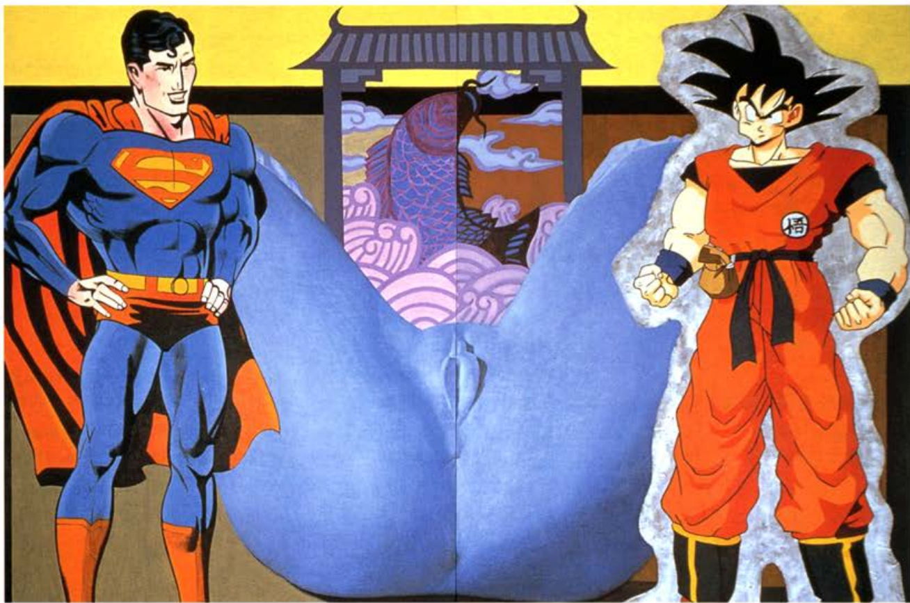
「超人與悟空」1996 油彩·壓克力 194X260cm

另外，畫面圖像類型還包括「文案」與「實物圖像」，雖然佔據畫面空間極小或不起眼的位