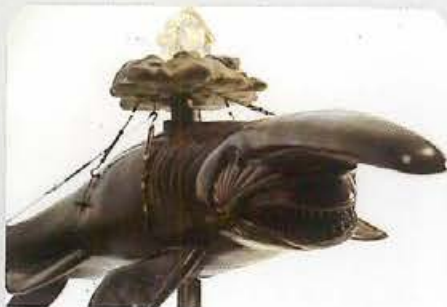
奧茲哥布林號_2014_銅、不鏽鋼、琉璃、LED