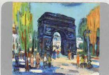
廖繼春 凱旋門 10號 油彩畫布 1971

睽違四年多的MimiLucy，於采泥藝術推出嶄新第二章「BACK TO LIFE」，延續以兩名虛構、電影角色般的人物登場-Mimi與Lucy這次將以科學家與少女為主人翁，展開一系列充滿神秘色彩的影像旅程。MimiLucy系列計劃藉由兩位合作藝術家同時置身於影像中與影像外的曖昧關係，探討創作者現實與虛擬間的雙重角色，當現實以不可逆轉之姿前進的時候，影像成為超越生死的唯一出口。