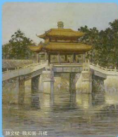
顏文樑 頤和園 荷橋