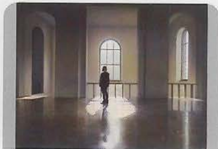
Brigitte Stenzel Time Rules Oil on Canvas 170 x 120 cm 2014

吳耿禎以剪紙創作聞名，本計劃試圖以他熱愛慢跑的節奏去規範自己的創作數量，集合式的呈現創作者日常生活的精神狀態，一張剪紙透過郵寄，交遞於一位參與者手上，參與者收到剪紙後，必須樂意生產一段文字作為交換，去回應這個禮物。是否這樣的生產交換能夠轉意我們從「觀看圖像」成為「文字閱讀」的想像可能？而這項以剪紙交換文字的計畫尚在進行中，也讓人好奇整件作品完結的最終面貌。