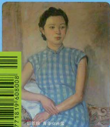
胡蔭鈺 青年女肖像