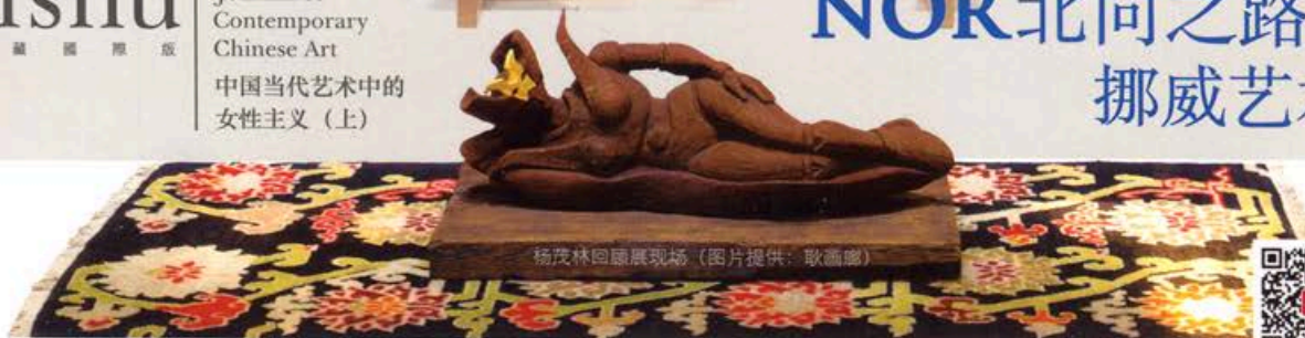
杨茂林回顾展现场