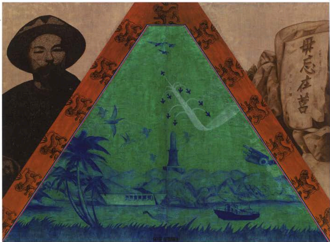
杨茂林,《大员纪事·毋忘在莒L9501》,1995,194×260cm,油彩、亚克力、画布

生活周遭,他谈道:“我开始做文化篇时,我认为所谓的‘文化’应该是要一代代繁殖的,但那时候大量进入的‘异文化’无法繁殖,所以作品里经常会有女性阴部的隐喻,配上卡通人物或塑料阳具的形象,他们很快乐,但无法生殖。”