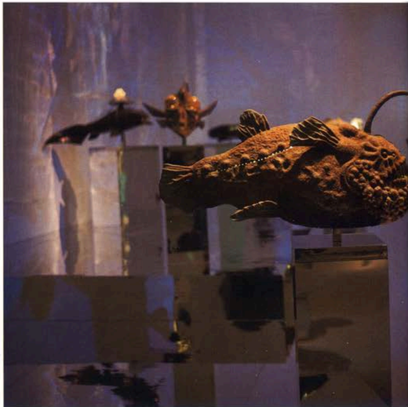
杨茂林,《奥兹吉祥鲷号》,2014,铜、不锈钢、水晶、LED,62×33×104cm