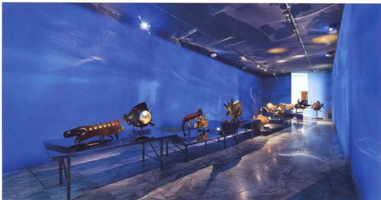
楊茂林回顧展·展場一隅·尋找曼荼羅。

text_Hsiao-Han Su_蘇筱涵