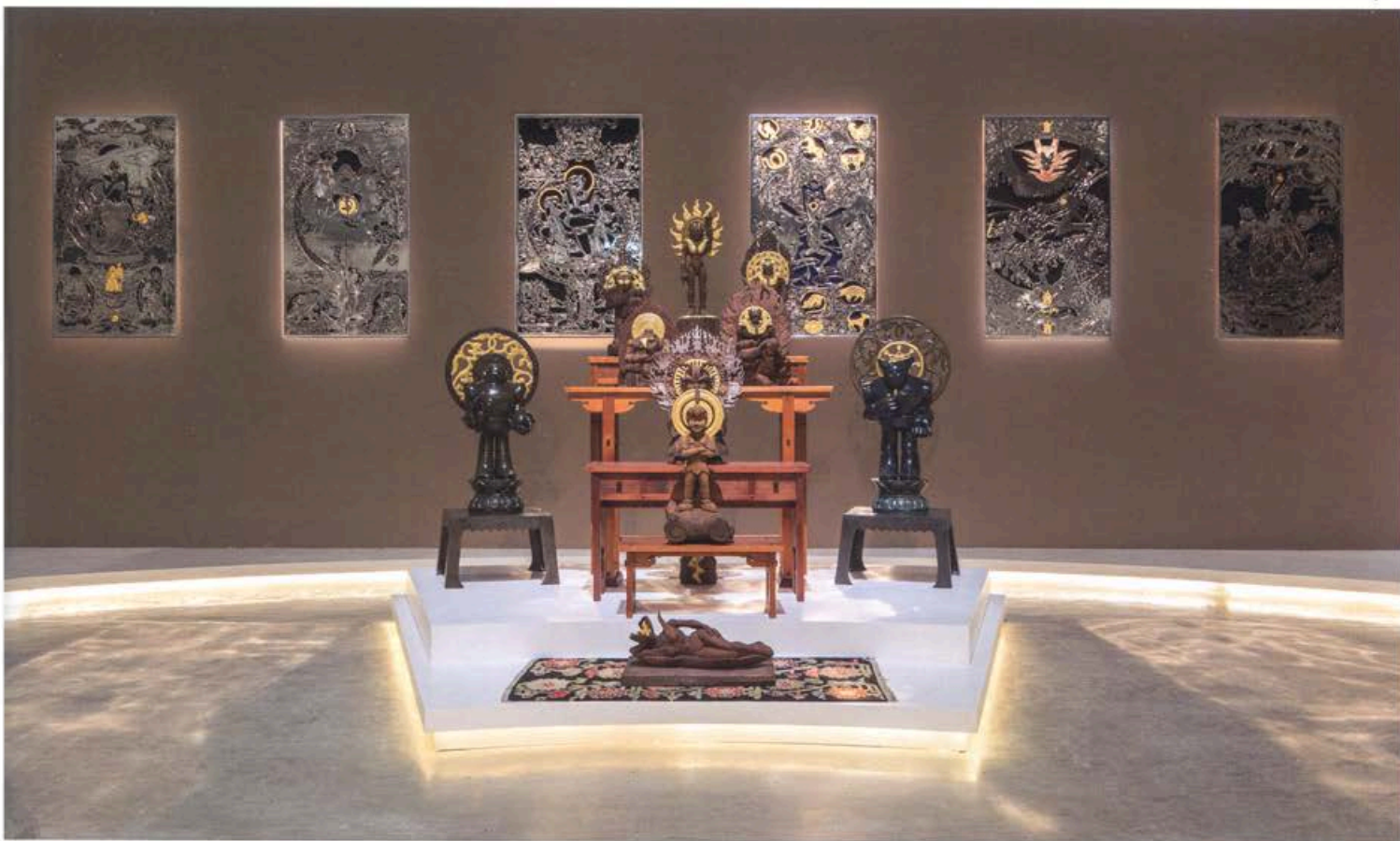
楊茂林回顧展·廣場一隅·仙班出列。

「MADE IN TAIWAN 歷史篇」便包含「圓山紀事」（1991）、「百合紀事」（1993）、「熱蘭遮紀事」（1992-93）與「大員紀事」（1994-95）等系列畫作。1999 年以後，楊茂林進入國立藝術學院（今台北藝術大學）美術研究所就讀，此時期他接觸了電腦影像合成技術，創作上亦出現突破性發展。