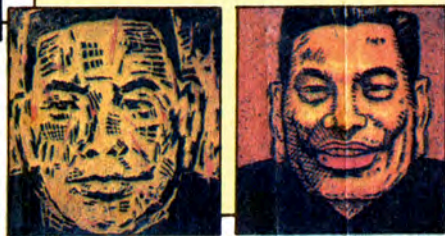
↖ 吳天章「蔣經國的五個時期」·1987。

視所謂大人物的權威，以史學圖像揭露意志的恐怖與毀滅性。 他們三個人在1983年風格漸臻於成熟，如果說有共通之處，那就是他們的抗議性以及粗筆觸的運用。另外，他們三個人在一起所形成的振動頻率，使畫面上出現光子跳躍式的光線效果。 「一〇一」的理性、參與、發展自我，很多人認為，他們的存亡，為後現代的潮流做了人的見證！ （吳天章、楊茂林、盧怡仲聯展：木石緣5月4日、23日，台灣省立美術館5月1日至25日。）