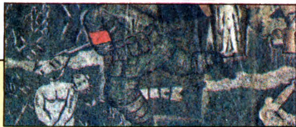
↓ 吳天章「關於暗綠色的傷害」·1989。